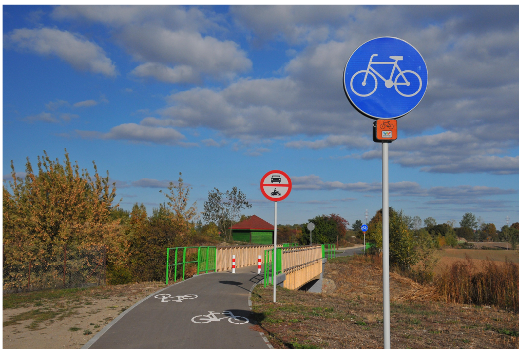
Przykład realizacji kładki rowerowej. [Projekt Arkas – Projekt, fotografia własna].