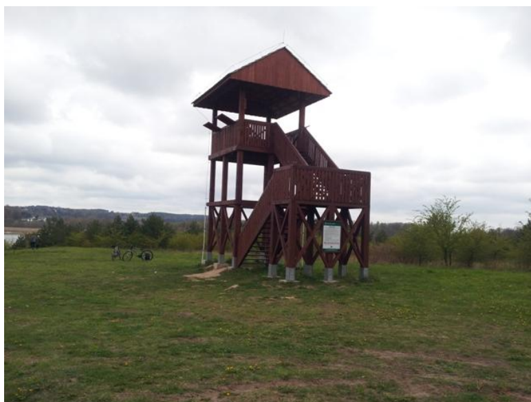
Przykład zrealizowanej wieży widokowej.