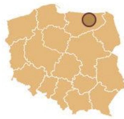
Ryc. 1 – Lokalizacja planowanej trasy rowerowej na tle Polski

Planowana trasa rowerowa przebiega przez obszary wchodzące w skład Związku gmin „BARCJA” – gminy Korsze, Reszel, Kętrzyn (m. Kętrzyn), Barciany i Srokowo. Na granicy gmin Kętrzyn i Węgorzewo trasa zostanie dowiązana do Mazurskiej Pętli Rowerowej (znajdującej się na terenie gminy Węgorzewo).