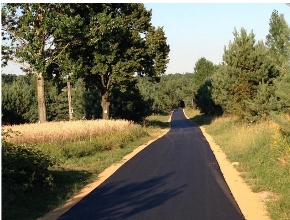
fot. nr 4 – przykładowa realizacja wariantu IF[szlak orlich gniazd,www.umigzarki.pl]

Zakres prac związany z wykonaniem ścieżki wariantu IG obejmuje m.in.: