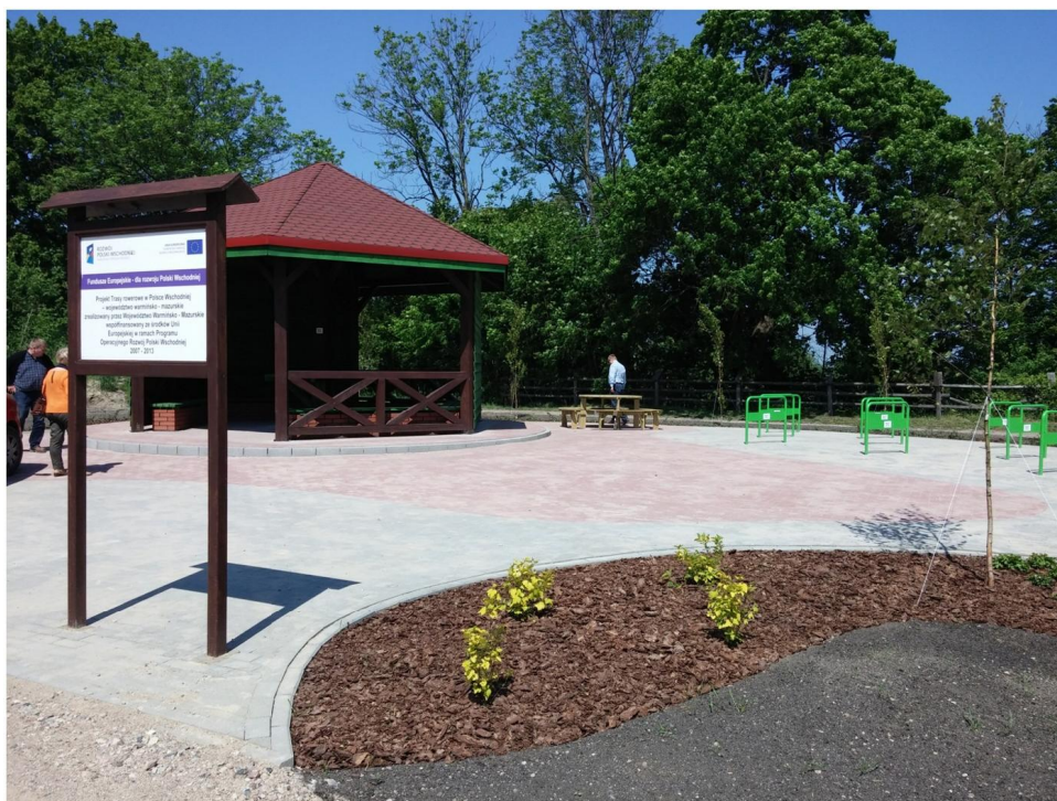
Przykład zrealizowanego obiektu MOR [projekt Arkas-Projekt]