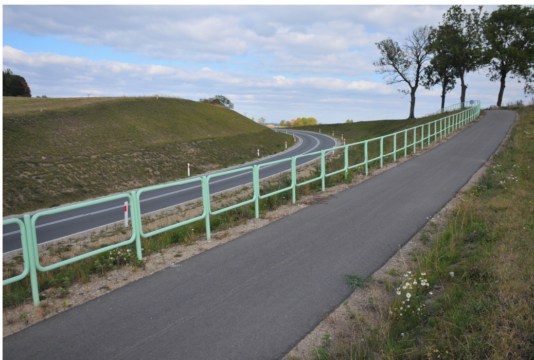
fot. nr 2 – przykładowa realizacja wariantu IB [projekt Arkas-Projekt]

Zakres prac związany z wykonaniem ścieżki wariantu IE obejmuje m.in.: