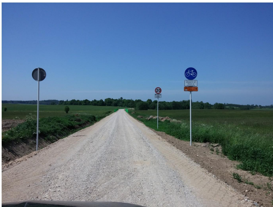
fot. nr 6 – przykładowa realizacja wariantu IID [projekt Arkas-Projekt]

Zakres prac związany z wykonaniem ścieżki wariantu III obejmuje jedynie oznakowanie szlaków istniejących, bez ingerencji w trasę ani konstrukcję ścieżek.