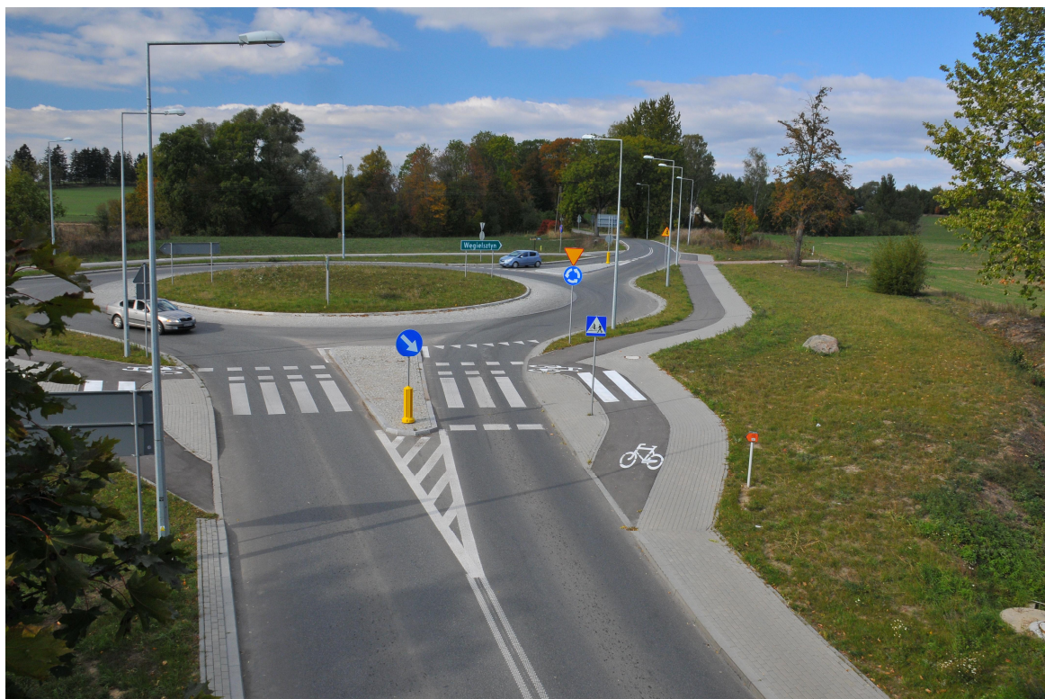
fot. nr 3 – przykładowa realizacja wariantu IE [projekt Arkas-Projekt]

Zakres prac związany z wykonaniem ścieżki wariantu IF obejmuje m.in.: