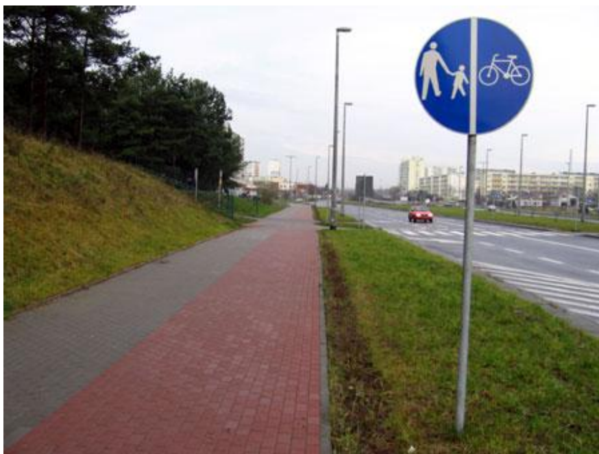
fot. nr 5 – przykładowa realizacja wariantu IG

Zakres prac związany z wykonaniem ścieżki wariantu IIA obejmuje m.in.: