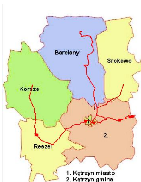
Ryc. 2 – Schemat przebiegu trasy rowerowej na terenie powiatu kętrzyńskiego (kolor czerwony)