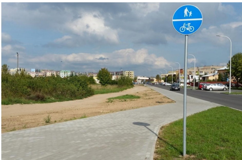
fot. nr 1 – przykładowa realizacja wariantu IA.

Zakres prac związany z wykonaniem ścieżki wariantu IB obejmuje m.in.: